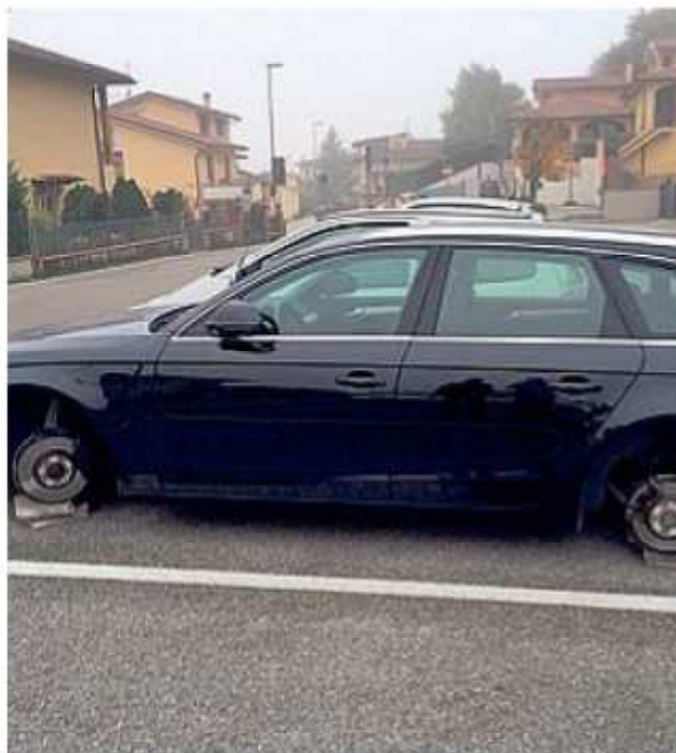
Brutta sorpresa per il proprietario dell'auto che è stata ritrovata senza le ruote. I ladri hanno agito nella notte

casello» sono previsti altri 19 milioni di euro, e un tratto della nuova strada servirà anche da «argine» per la cassa d'espansione dell'Arno, quella di Pizziconi. Del primo lotto invece fa parte, o almeno ne faceva parte in origine dieci anni fa, anche la rotonda fra la Pian di Rona e la 69, allo svincolo dei Ciliegi, dove ogni mattina si formano file chilometriche di veicoli diretti al casello dell'Al che non riescono ad entrare nella 69.