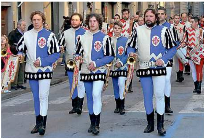
Sopra una fase del corteo che ieri pomeriggio ha inaugurato Autumnia: subito migliaia di persone sono accorse a Figline

Migliaia di persone al debutto della manifestazione