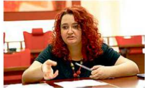
P.F. PRIMO CITTADINO Il sindaco di Figline-Incisa, Giulia Mugnai

comunale – ha l'obiettivo di sostenere economicamente le famiglie in stato di disagio economico e sociale, e per evitare che queste difficoltà inducano i genitori a far smettere i ragazzi di frequentare la scuola». Per avere ulteriori dettagli sulle soglie di contribuzione gli interessati possono consultare il sito del Comune dove è possibile scaricare la necessaria modulistica da consegnare entro il 4 dicembre.